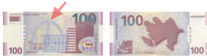
Fig. 1: retrieved 2011-10-21 from http://www.azerbaijan.az/portal/General/Currency/currency_01_e.html , explaining the current banknotes. Marked red is the Manat symbol and its identification in the text.