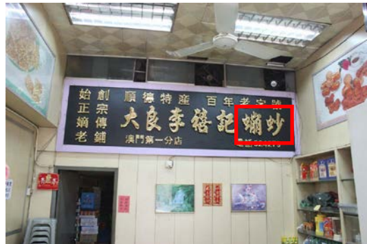
Figs. 17 to 24 What the People Said about 蠋炒 in Sina Weibo