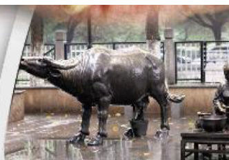
人们以后或许只能通过公园里的雕塑来回忆渐行渐远