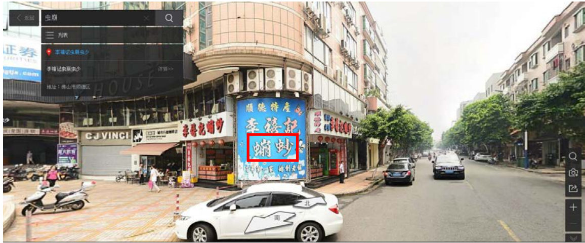
Fig. 12 A Store Which Used 蠍蚱 as Its Store Name in Shùndé