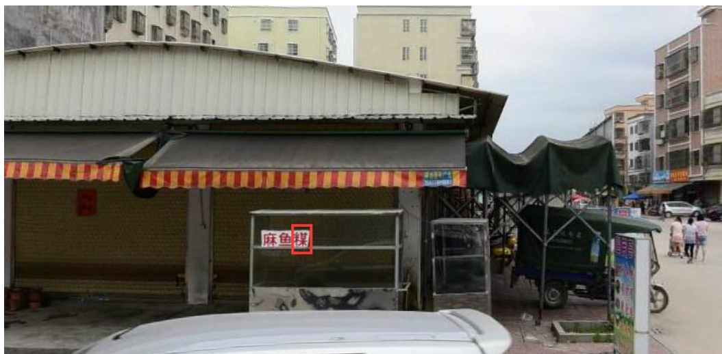
Fig.9 A food stall of 麻鱼糲 on a road of Haifeng County.

【糜】mue~5 ①=【糲】mue~5 稀饭,一般不太稀烂 ②麻疹:做~ || ‘糲’,读音与“煤 bhue5”相近引起的自造字。很可能是前几年开大排档的外省人率先自造使用的。踏入二十一世纪,海丰县城和汕尾市区有几间饭店和夜间路边大排档先后在门口推出招徕顾客的活动广告牌,上面几个字中就有“糲”这个字。后来,有的店干脆用作店名招牌字。2006年,有人在《汕尾日报》发表文章,反对写自造字“糲”,提倡写本字“糜”。但这个呼吁根本不管用。2007年度,海丰县城使用“糲”的饮食店更多,仅有一家用“糜”不用“糲”。外省人在海丰方言的进化过程中有两个突出的贡献,一是将“糜”字错写成“糲”,二是将“纸皮”错读成“蛇皮”○另见【纸皮】zua2 pue5