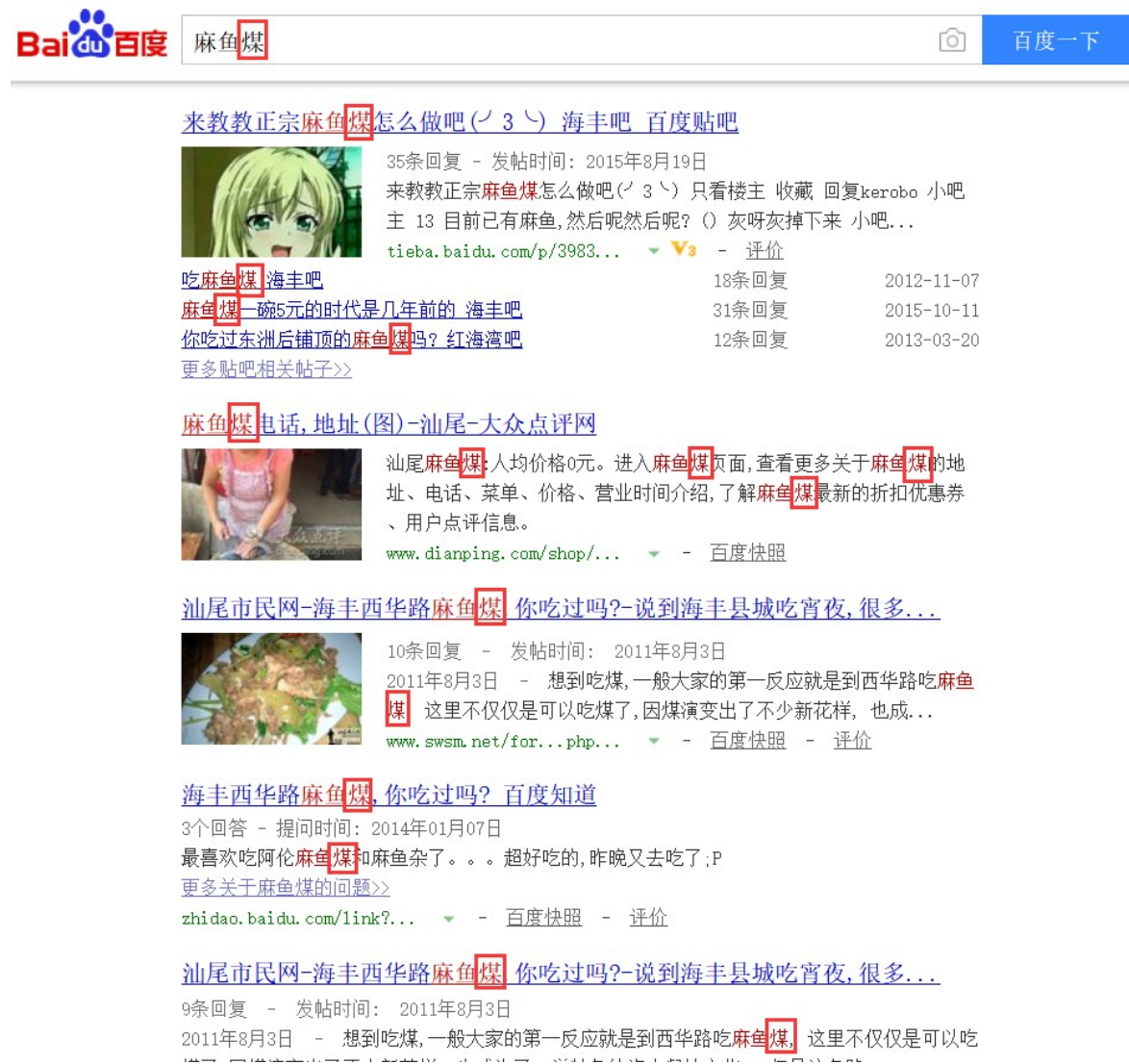
Fig.2 Many people use “煤” as “煤”.