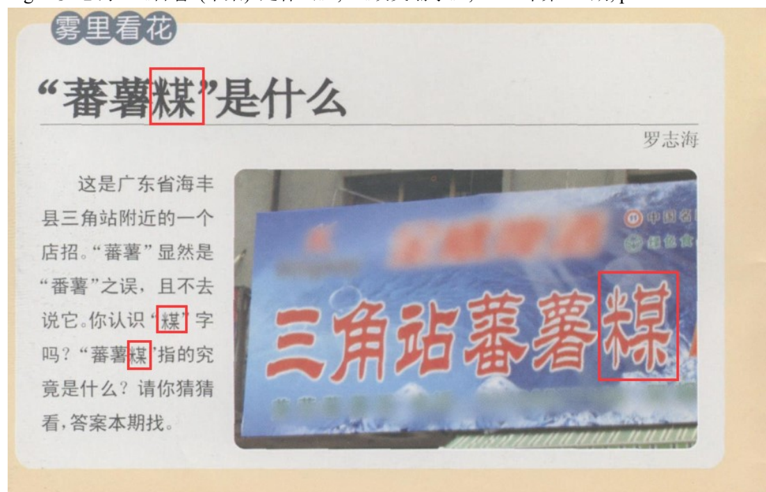
Fig.7 罗志海:《“蕃薯煤”是什么》解疑,《咬文嚼字》,2009年第12期,p48