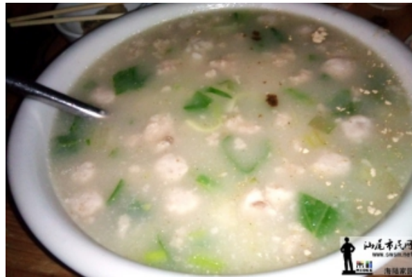
Fig.5 Someone who introduces the snacks in Shanwei and chiefly Haifeng County, the 番薯糕 and 麻鱼糕 are all included. The left one is 麻鱼糕, the right one is 番薯糕.

http://www.swsm.net/forum.php?mod=viewthread&tid=9523